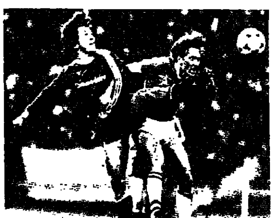
اللاعب لوتار ماتلوس (بارين ميونخ) واللاعب الآن هاربر (ايفرتون) في صراع على الكرة في تصفيات كأس الكؤوس الأوروبية